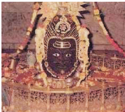
Mahakaleshwar Temple, Ujjain